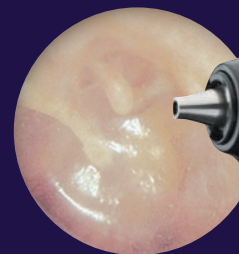
Otoscopio MacroView® Plus de Welch Allyn