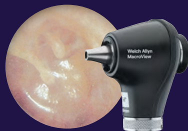
Otoscopio MacroView® Plus de Welch Allyn