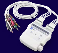
Módulo de Adquisición Inalámbrico Welch Allyn (WAM)