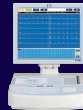
Welch Allyn ELI 380 ECG